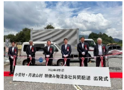
2023年8月に実施した共同配送 出発式の様子 (道の駅こすげ)