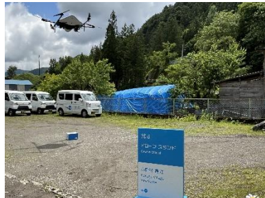
小菅村のドローン配送の様子